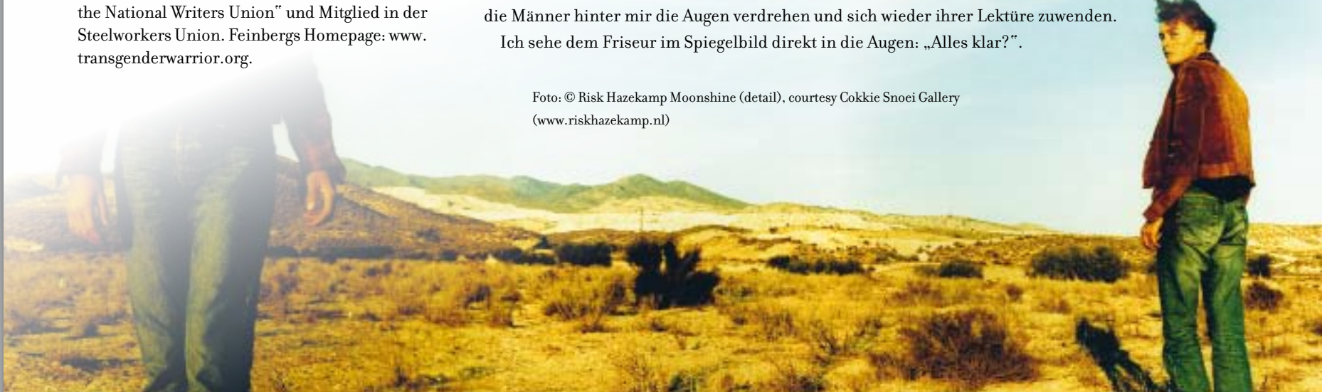
Foto: © Risk Hazekamp Moonshine (detail), courtesy Cokkie Snoei Gallery ( www.riskhazekamp.nl )

Ich sehe dem Friseur im Spiegelbild direkt in die Augen: „Alles klar?“.